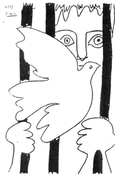
Picasso, „Amnistia“, 1959:

© Succession Picasso / VG Bild-Kunst, Bonn 2005